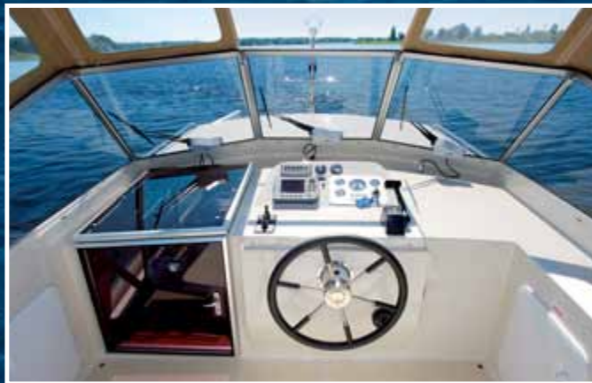
Fahrstand Gute Rundum- und Instrumentensicht ist garantiert.

Unser Testboot ist auf die optimale Nutzung mit mehreren Personen ausgelegt. Das heißt achtern eine Kabine mit Doppelkoje, eigener Dusche und WC sowie eine Bugkabine mit Doppelkoje und weiteren Nassbereichen. In der Mitte liegt der Salon mit Pantry und wandelbarer Sitz-Liege-Kombination. Gefahren wird nur vom Cockpit aus. Dies erledigt der Skipper von einer passend gepolsterten 1 ½-Personen-Sitzbank. Da die Bank freistehend ausgeführt ist, lässt sich für (fast) jede Fahrergröße eine passable Sitzposition finden, von der man Steuerrad und Schaltung (hakelte bei uns auf Voraus) gut im Griff hat. Nachteil bei Seegang: Die Bank verschiebt sich schnell und bietet nur wenig Halt. In dieser Situation stellt man sich am besten hin und gleicht den Wellengang