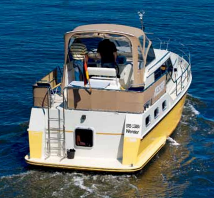
An Deck Stabile Reling mit Relingpersenning, Handläufe, Heckleiter und Antislipstrukturen sorgen für Bewegungssicherheit.

zufuhr gewährleisten in den ausreichend großen Nasszellen ebenfalls Bullaugen. Wie auf einer Charterversion üblich, findet man gute Staumöglichkeiten auf dem gesamten Boot.